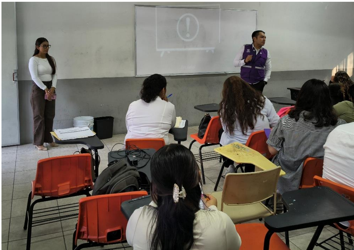
Fotografía 3. . Personal de la Coordinación de Prerrogativas y Partidos Políticos, impartiendo el curso a los alumnos.

ANEXO DEL INFORME 027/CPPP/SO/21-05-2026 EVIDENCIA FOTOGRÁFICA