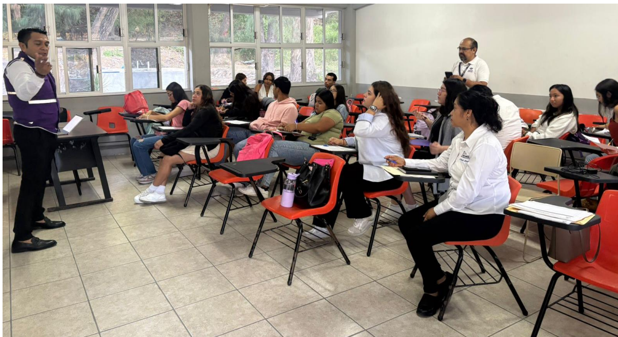
Fotografía 1. Personal de la Coordinación de Prerrogativas y Partidos Políticos, impartiendo el curso a los alumnos.