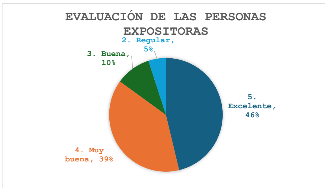
Grafica 3. Representación de los resultados a la aplicación de la evaluación de las personas expositoras, bajo las siguientes interrogantes: